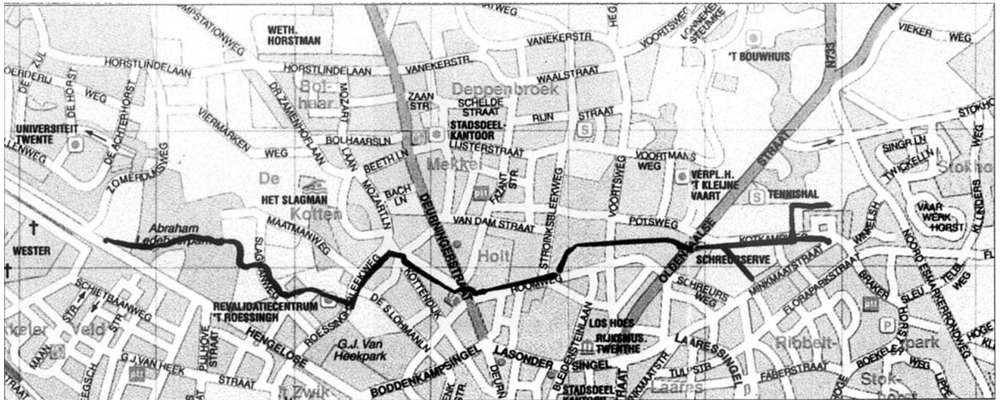
De hop van de Roombeek is in dit fragment van Enschedees plattegrond ingekleurd. Pas vanaf Het Roessingh is de Roombeek bovengronds