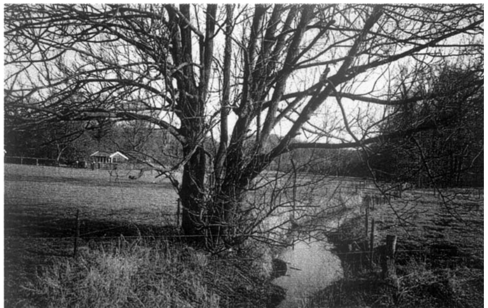
Nabij de Hengelose straat is de Roombeek bovengronds

f50.- schadevergoeding per dag zolang de gemeente haar verontreinigde water op de Twickeler vaart loosde. Met het reinigen van afvalwater werd elders nog geëxperimenteerd. Enschede had meerdere problemen: vuil afvalwater, geen overeenstemming met Lonneker en WO I. In augustus 1919 geeft de gemeente Enschede opdracht aan het Technisch Bureau Holland-Zweden om een proefinstallatie voor rioolwaterzuivering te bouwen op een terrein tussen de Deumingerstraat en de Drienerweg op een stuk grond dat was bestemd voor de aanleg van een weg (Landstraat ?) Er zal dan