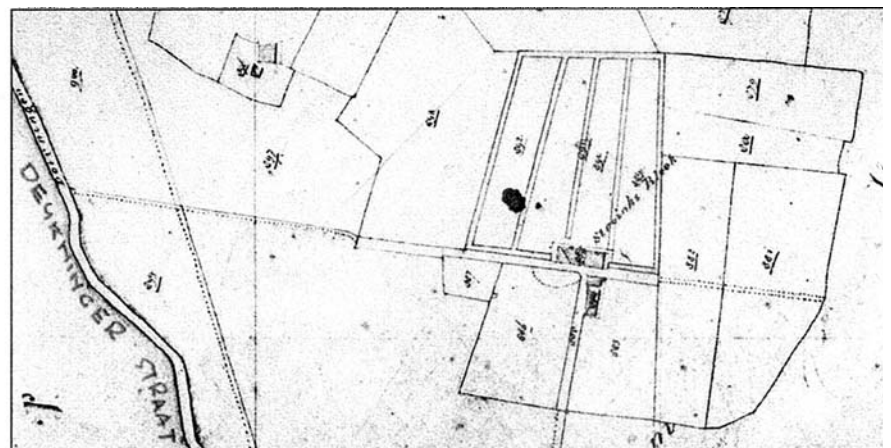
Het Nieuwlustpark(links) is aangelegd precies binnen de omtrek van de oude Stroinksbleekweg(rechts), zoals een oude kadasterkaart laat zien