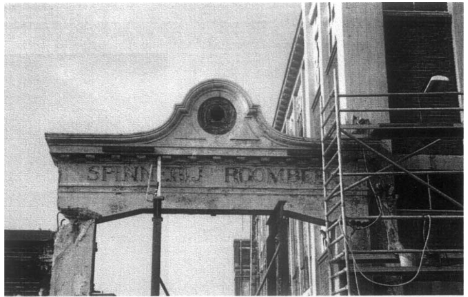
De oude toegangspoort van Spinnerij Roombeek staat er niet meer ...

is, n.l. het gedeelte ten westen van de Kievitstraat. Deze laatste bleek (II) is later het Nieuwlustpark geworden. Had de Roombeek hier iets mee te maken? De Roombeek heeft niet langs de eerst genoemde bleek gelopen; hier liep de Bolhaarsbeek langs. Die kwam uit het gebied Voortmansweg langs de Deppenbroekweg (nu Lijsterstraat) en dan achter het voetbalveld van Roombeek richting de eerstgenoemde Stroinksbleek (I), doch raakte ook deze niet. Liep de Roombeek dan wel langs de andere Stroinksbleek? Ook daar is geen bewijs voor gevonden. Waren de bleken wel afhankelijk van beken of lagen ze op een wel ?? Op de oudste kadasterkaart (ca. 1832) van het Roomveldje staan beide bleken aangegeven maar geen Roombeek en ook geen Roomweg. De Roomweg is ontstaan in de toenmalige gemeente Lonneker uit de markenverdeling van 1848. Toen de markengronden (Eschmarke) werden verdeeld (verkaveld) moesten deze percelen bereikbaar zijn zonder dat men over elkaars grond hoefde. Zo zijn toen vele wegen aangelegd en aan de gemeente Lonneker overgedragen. De Roombeek en de Roomweg werden toen voor veel kavels de perceelsgrens. De gemeente (marke) was nu niet meer verantwoordelijk voor overlast en onderhoud van de beek, maar de eigenaren van de gronden waar de beek door of langs liep. In het gemeentearchief bevindt zich een Legger van waterlopen uit 1853 waarin o.a. de Roombeek is opgenomen en als volgt omschreven: